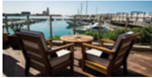
Marina Muse Bar & Restaurant