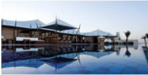
Shore House - The Ritz-Carlton