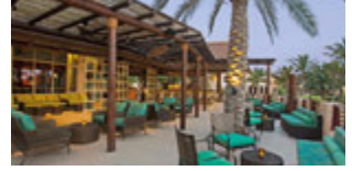
Trader Vic's Mai Tai Lounge