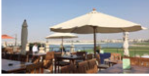
The Bay Sports Bar