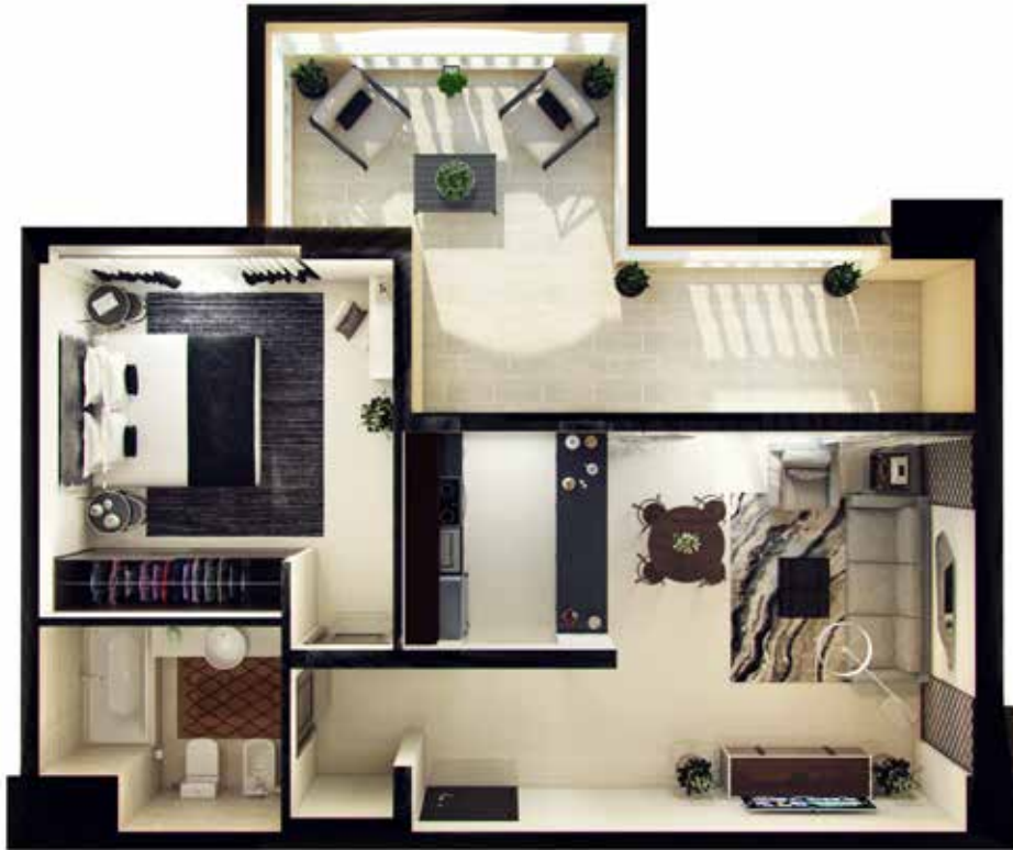
1 Bedroom Type-1